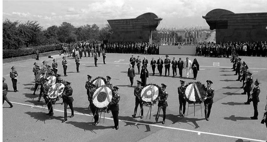
Վերջերս ընդգծուած 22 արտետազերներն են գիտնականները: Պետականութիւնը եկած էր Սարգսյանի ղեկավարութեան տակ:

Պատմաբան Լեւոն Ելլմազ պահանջները յիշեցէք կուսակցութիւնը լոյս տեսած էր 2010-ին: Արժեքատր պատմաբանին հետ խօսեցանք մերօրեայ իրողութեանը շուրջ: Մեր առաջին հարցումն էր ԱԲԲ կուսակցութեան իշխանութեան եկած 2002-էն սկսեալ վերջին 11 տարիներու իրադարձութիւնները: