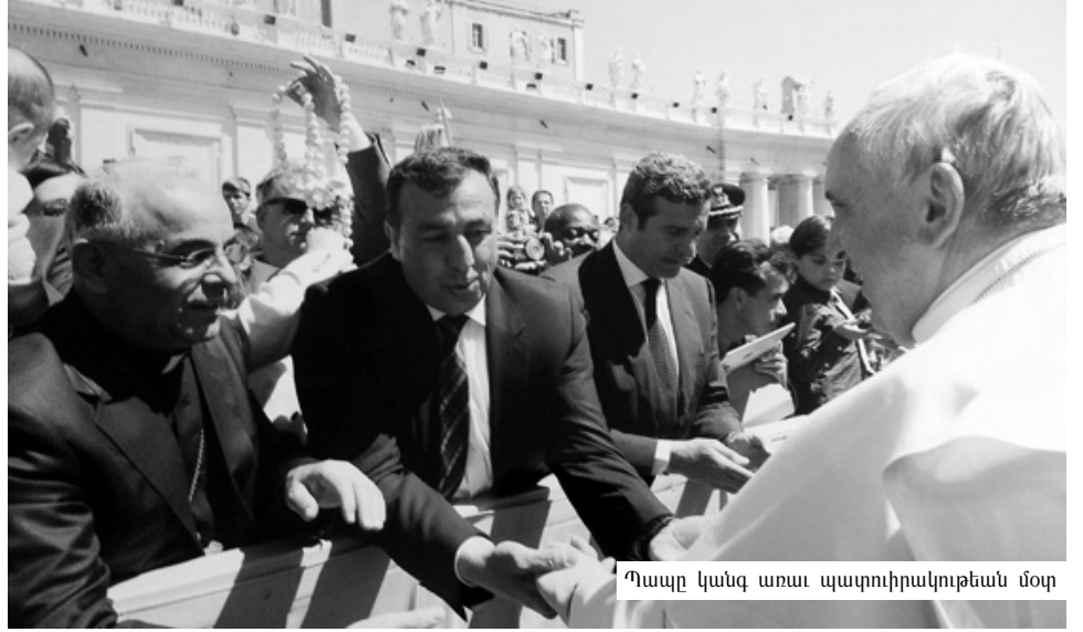
Պապը կանգ առաւ պատուիրակութեան մօտ

Ուղեկցողները վերադարձին երբ կը փոխանցէին իրենց փառաբանութիւնները, շեշտը կը դնէին մին դրական, մին ժխտական երկու երեւոյթներու վրայ: Անոնք նախ փառաբանուած էին դիմաւորելու համար օդակայան եկող պատուիրակութեան կազմակերպուածութիւնն ու կարգապահութիւնը: Գնահատանքով կ'արտայայտուէին այդ պարկերներու մասին: Իսկ իբրև ժխտական երեւոյթ անոնք կը մարտնչէին նոյն պատուիրակութեան ներկայացուցիչներու անհարգողութիւնը թուրքիայէն եկողներու նկատմամբ: Արդարեւ այդ մթնոլորտը զգալի էր լուրը հաղորդող յաջորդ օրուայ «Ազդակ»ի էջերուն մէջ: «Ազդակ» անտեսած էր թուրքիոյ հայոց փառած հոգաբարձութիւնը եւ կազմակերպչական աշխատութիւնը եւ քէսապցիներու Լիբանան ժամանումը վերագրած էր կուսակցական ջանասիրութեան: Աս երեւոյթը ընդգծում յառաջացուցած էր քէսապցիներուն ընկերակցող կազմին վրայ, որոնց փրամադրութիւնը իր արտաքինումը գրաւ Պոլսոյ հայերէն օրաթերթերու մէջ թաթուլ Հայր Սուրբի ստորագրութեամբ: Պարբիտարք նշել որ ազգայնականութիւնով թունաւորուած միտքերը դեռ փակախի բաւական փրստ են հայ ժողովուրդի հոգեբան գիտակցելու եւ այդ ուղղութեամբ պարզած ռազմավարութիւն ձեւաւորելու համար: