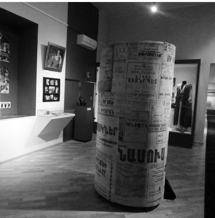
Մենք մրսանք Չարենցի Անտան Արուեստի եւ Գրականութեան թանգարան, որը վերջերս նորոգուել էր եւ բացել իր «Մշակութային ճեմարան» մշակութային ցուցադրութիւնը: Թանգարանը չէր սպասում գիշերուան, երբի այն պարճանում, որ այս 5 օրաներում պիտում էր մշակական գիշեր. ցերեկուայ լոյսը չէր թափանցում ներս: