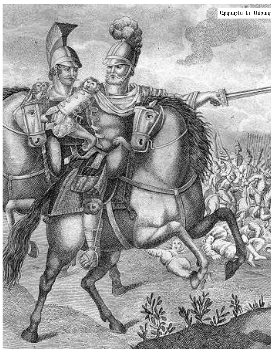
Արքաշէս եւ Սմբար

Երուանդի թագաւորութեան ժամանակ Երասխ (Արաքս կամ Արազ) գետը բաւականաչափ հեռացած էր Արմափրի բլուրէն, իսկ երբ ձմեռը երկարաւոր ըլլար, հիսափային քամիները կը ստեղծէին գետը եւ արբունիքը կը գրկուէր խմելու ջուրէն: Այդ պարագային Երուանդ արբունիքը Արմափրէն կը տեղափոխէր դէպի արեւմուտք, միակտոր ապառաժ բլուրի մը վրայ, որուն մէկ կողմը կը շրջափակէր Երասխը, իսկ դիմացէն կը հոսէր Ախուրեան գետը: Երուանդ կը պարսպապարէր բլուրը, ժայռերուն մէջ փորուածքներ կը բանայ ու կը հասնի մինչեւ բլուրի յարակը, հաւասարացնելով գետին մակերեսային, որ գետի ջուրերը հոսին փորուած ջրամբարին մէջ ու ըն-