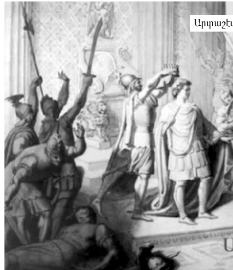
Արքաշէս կը թագադրուի

Այդ ժամանակ մանուկ Արքաշէս արդէն հասուն տղամարդ դարձած էր Պարսկաստանի մէջ: Իր դայեակը՝ Սմբար իր ռազմական հմտութեամբ շար քաջագործութիւններ կը կատարէր յօգուտ Պարսկաստանի եւ ջերմ համակրանքին կ'արժանանար արիւնքներու նախարարներուն, որոնք ալ կը բարեխօսէին իրենց թագաւորին որ Սմբարին արժանացնէ իր փափաքած պարգեւներուն: Պարսից թագաւոր սիրով կը համաձայնի եւ կը յանձնարարէ նախարարներուն, որ սորվին թէ ինչ կը ցանկանայ այդ քաջ մարդը: Նախարարները կը պատասխանեն,