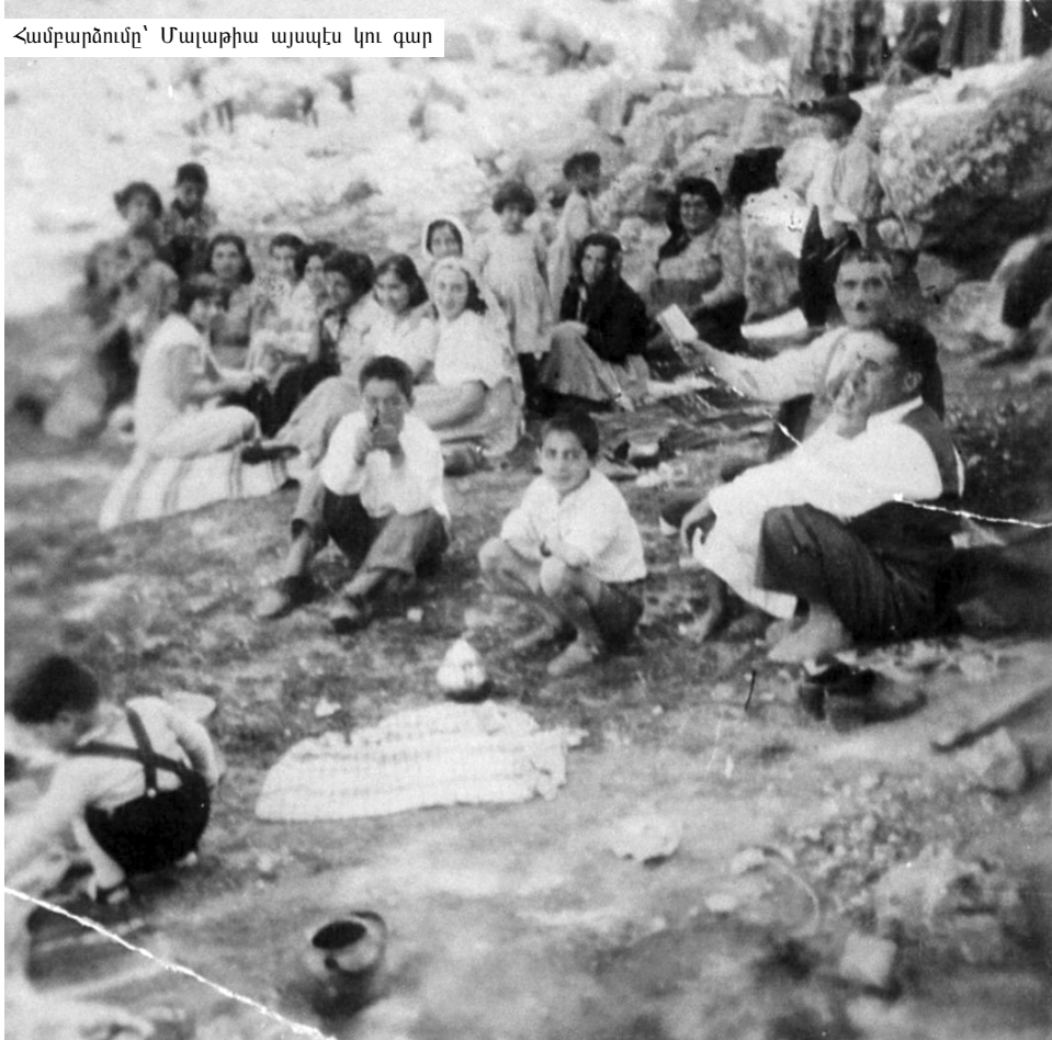
Համբարձումը՝ Մալաթիա այսպէս կու գար