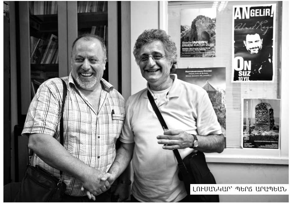
Սարգի Նովայի անցեալի վարիներէն Տօնին եւ Մեկիք եկան Ալօս եւ հաճելի գրոյց մը ունեցանք: Մեզ հետ էր նաեւ Արարիկ մէջ անտրեանելի Սայաթ Նովայի հոգին:

Վարդանոյշ հորաքոյրը մեզի պատմեց նաեւ Ս. Սարգիսի, Բարեկենդանի, Վարդապետի եւ այլ փուներու մասին յուշեր, որոնք ալ կը գրենք այլ առիթներով: