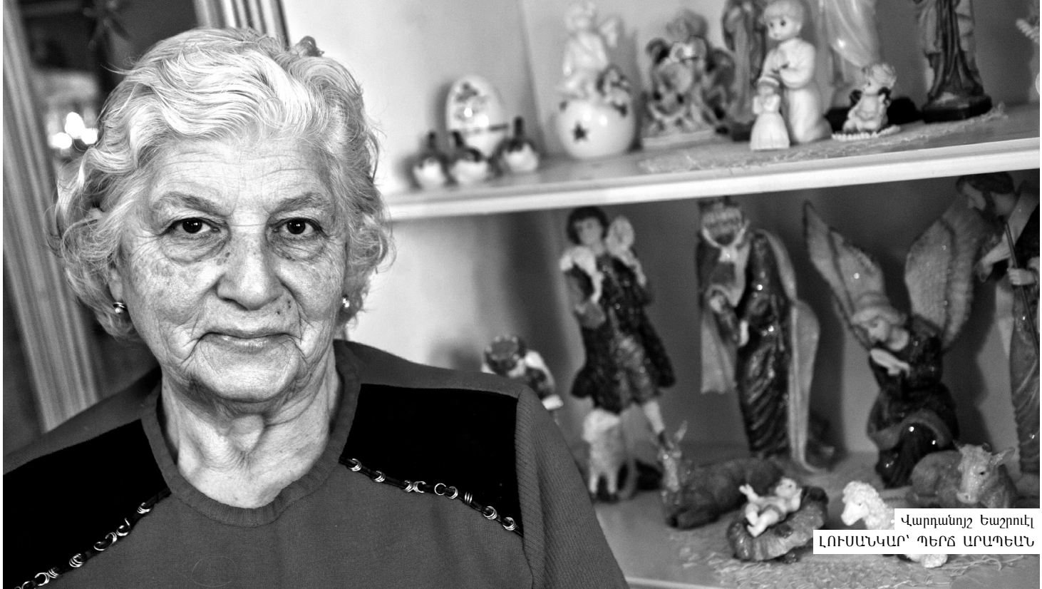
Վարդանոյշ Եաշրուէլ ԼՈՒՍԵՆԿՈՓԱՐ ԴԵՐՆ ԱՐԵՊԵՆԸ

Համերգին առթիւ կը շնորհատրեք 42-րդ փարիքը, մաղթելով որ անպակաս ստանալի Սայաթ Նովայի հոգին բոլոր Սայաթ Նովայիներու հոգիներուն, ու փրկուելու հետ եւ անոնք երգեն նաեւ իրենց թոռներուն ու ծոռներուն հետ, անոնց մականին փակ...: